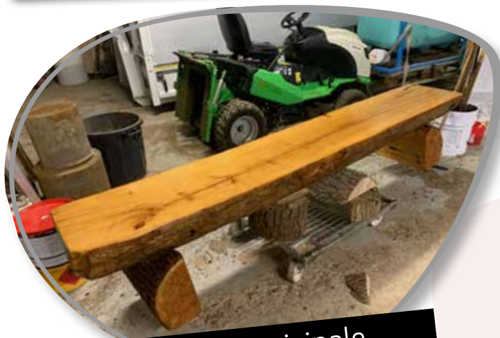
La vie municipale Pages 4 à 7