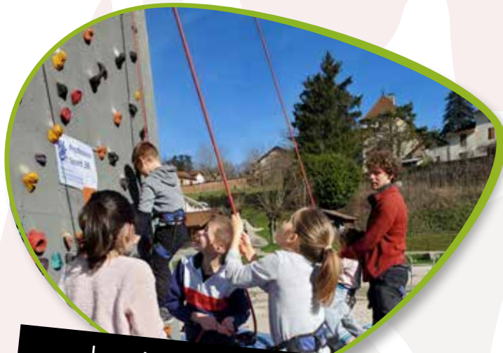
La vie des écoles Page 8