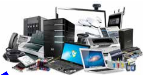
L'équipement informatique des écoles et de la mairie (45 394,40€)