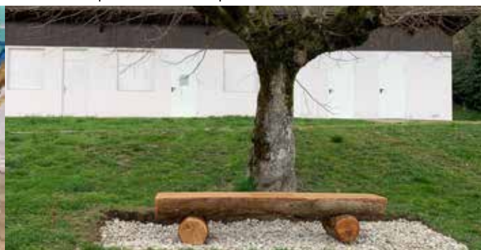
Banc terminé à l'atelier puis installé, prêt à recevoir des générations de promeneurs