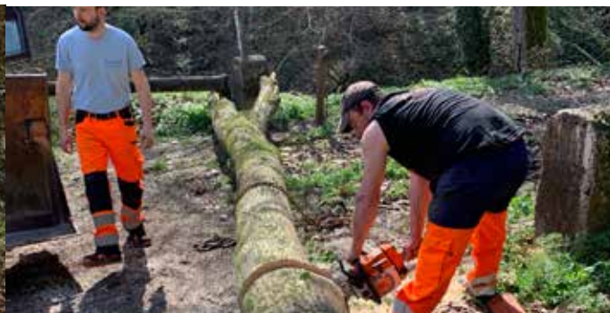
Récupération des arbres et découpe en morceaux