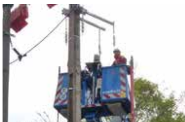
Le renforcement des réseaux électriques (57 750€)