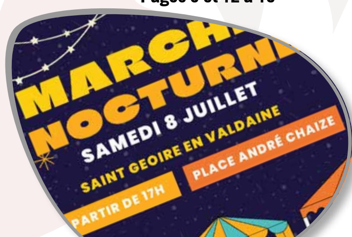
La vie économique Page 19