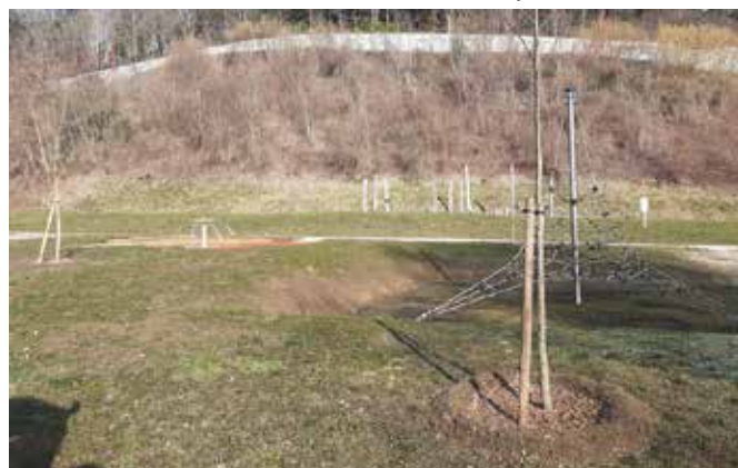
Arbres installés à La Combe, près des jeux pour enfants