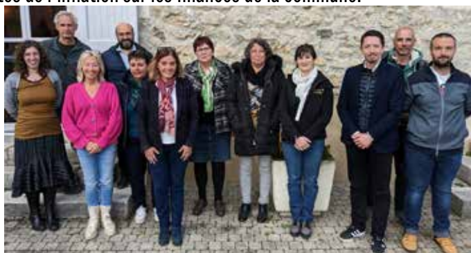
Madame Le Maire, Nathalie Beaufort (au premier plan, foulard autour du cou), entourée d'une partie de l'équipe du conseil municipal

Enfin, de nombreux investissements viennent améliorer le quotidien des habitants, en préservant la capacité à répondre aux besoins à venir.