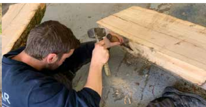
Chargement pour transport vers l'atelier et fabrication des bancs par notre service technique