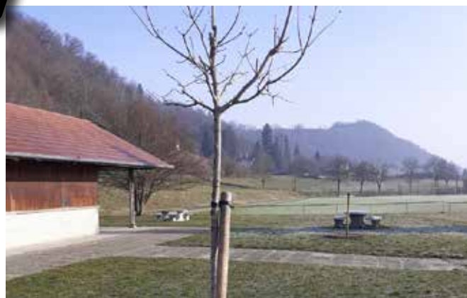
Les nouveaux arbres amèneront à terme de l'ombre, source de fraîcheur naturelle

Les trois canicules estivales ont rappelé combien la prise en compte des enjeux climatiques est devenue déterminante dans l'investissement des communes. Garantir la réduction de l'imperméabilisation des sols, favoriser la présence de la végétalisation sont autant d'actions qui vont venir à la fois renforcer la biodiversité et amener naturellement un peu de fraîcheur.