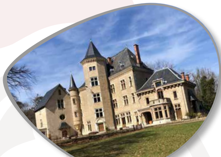
La vie du village Pages 9 et 12 à 15