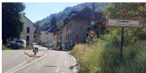
Les travaux d'aménagement de Champet (144 500€)