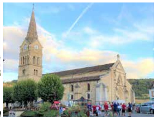
Les aménagements intergénérationnels, secteur de la Combe, de la Martinette et le pourtour de l'église (143 200€)