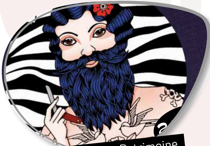
Art, Culture et Patrimoine Pages 16 à 18