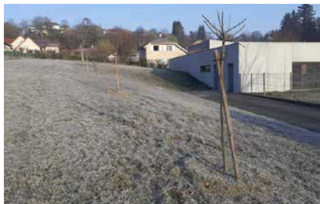
Arbres installés à proximité de l'école maternelle La Lambertière