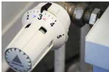
L'étude de changement des systèmes de chauffage – chaudière bois (16 128€)